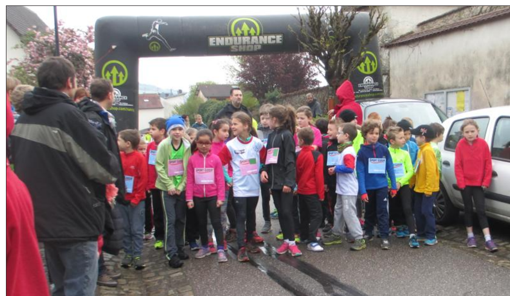
■ Les Poussinets sur le point de s'envoler.

Dimanche, les rues du village attendaient les coureurs et le soleil. Elles ont reçu les coureurs, grands et petits et la pluie... Qu'à cela ne tienne, les coureurs étaient là. Baby athlé, (- de 5 ans), vétérans 5 (plus de 80 ans) en passant par minimes et seniors, ils sont venus fouler les chemins maidiétois. Plus de 250 coureurs et une cinquantaine de marcheurs ont participé à cette 8 e édition des courses de la liberté. Tous les départs étaient donnés devant la mairie et