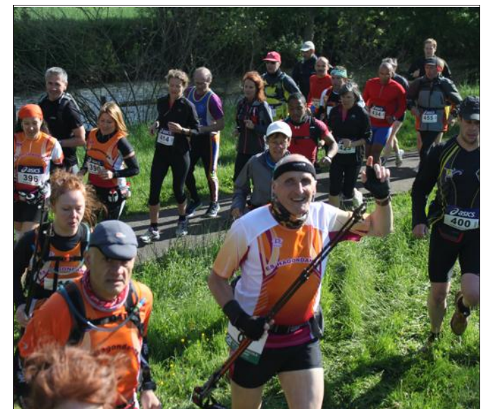
■ Les coureurs ont rendez-vous le 8 mai.

Plus d'infos sur le site du club www.acob-jeunes.com , sur leur page facebook « La Belledotrail » ou par téléphone au 09.67.24.27.18.