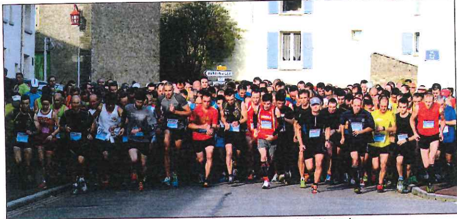
Plus belle affluence du trophée Sport-Loisir, les Foulées de la Goniche affichaient hier près de 600 engagés.